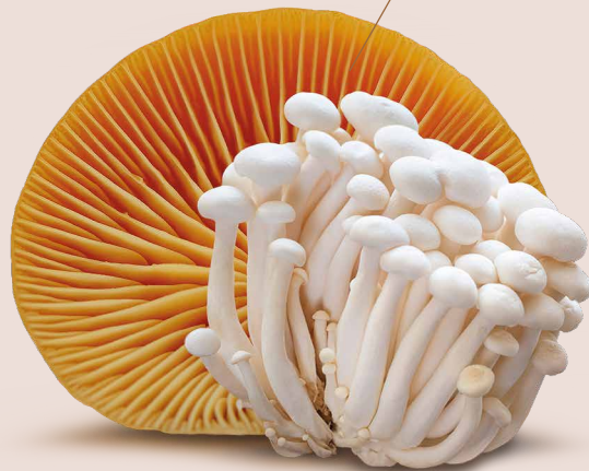
penízovka sametonohá Flammulina velutipes

Obrovským přínosem je zasazení nové řady do programu Regenerace v Pentagramu®. Každý z pěti mykoproduktů odpovídá příslušnému elementu a druhá část jeho názvu vždy koresponduje s hlavním orgánem patřícím k danému prvku: Mycopulm , který se postará o naše plíce a tlusté střevo, Mycoren posilující ledviny, prostatu a močový měchýř, Mycoshepar pečující o naše játra a žlučník, Mycocard podporující srdce i krev a konečně Mycopan hýčkáající pankreas (slinivku) a žaludek.