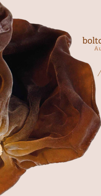
boltcovitka ucho Jidášovo Auricularia auricula-judae